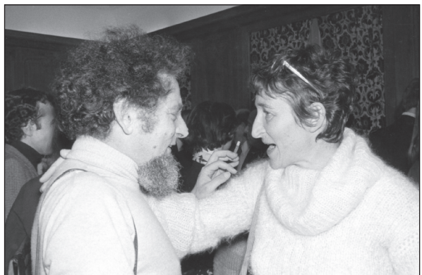
Georges Perec et Ela Bienenfeld lors de la sortie de La Vie mode d'emploi